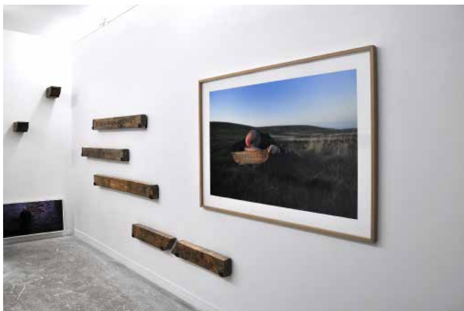
Vue d'exposition, Orlando Britto jniorio, Entre l'enthousiasme et l'abime , septembre 2015