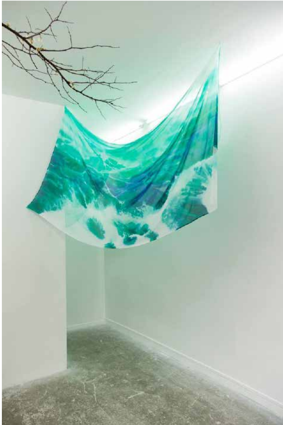
Vue d'exposition, Jérémie Paul, Opaline et Vâyou , janvier 2016