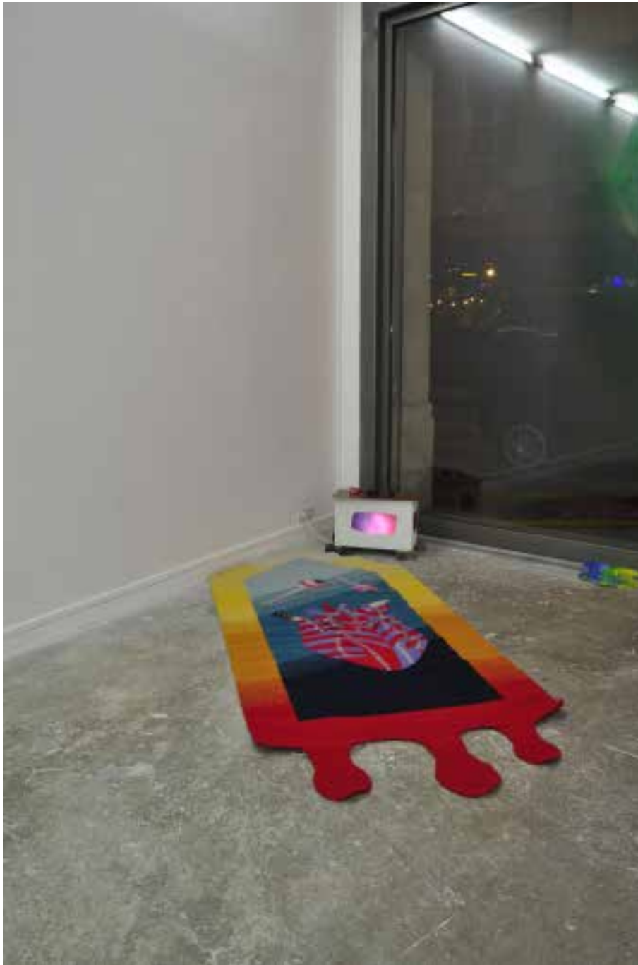
Vue d'exposition, Jérémie Paul, Opaline et Vâyou , janvier 2016