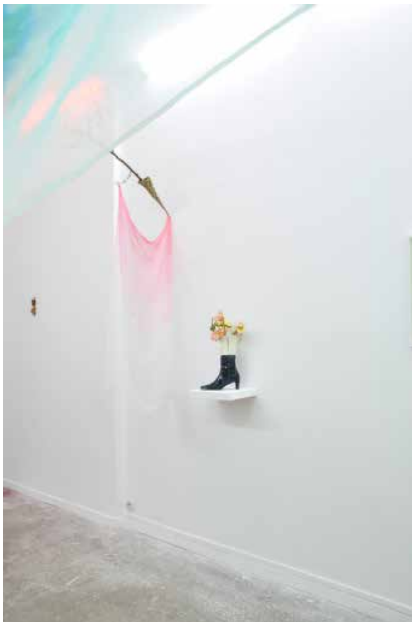
Vue d'exposition, Jérémie Paul, Opaline et Vâyou , janvier 2016