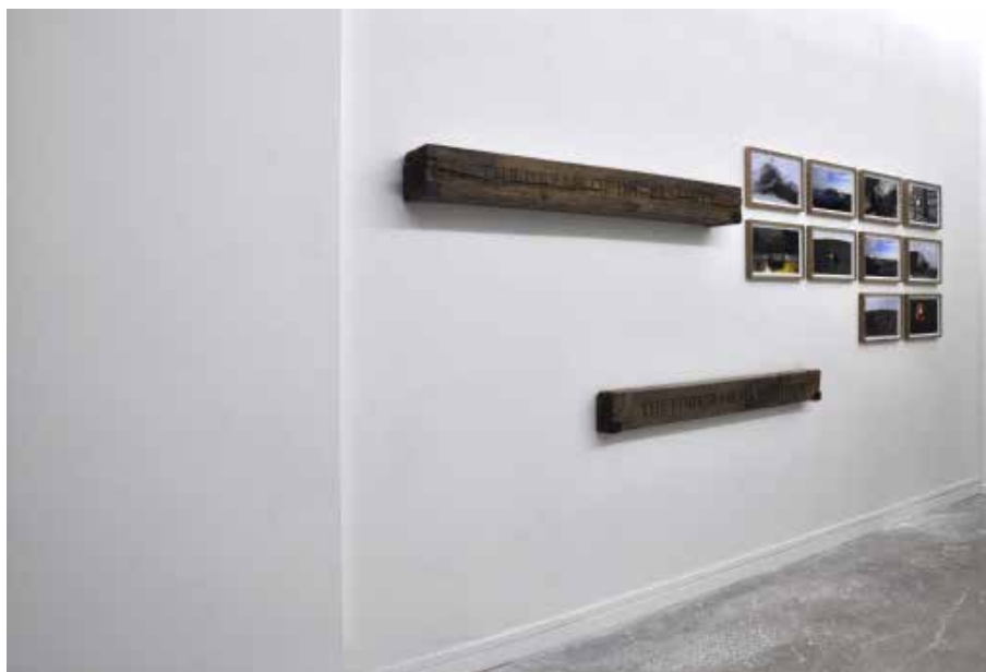
Vue d'exposition , Orlando Britto jniorio, Entre l'enthousiasme et l'abime , septembre 2015