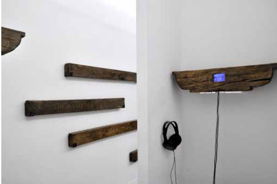
Vue d'exposition, Orlando Britto jinorio, Entre l'enthousiasme et l'abime , septembre 2015