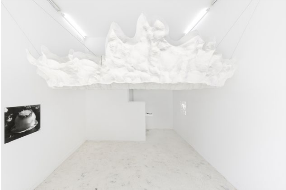
Vue d'exposition, Emmanuel Rivière, Le bruit des nuages , mai-juin 2017