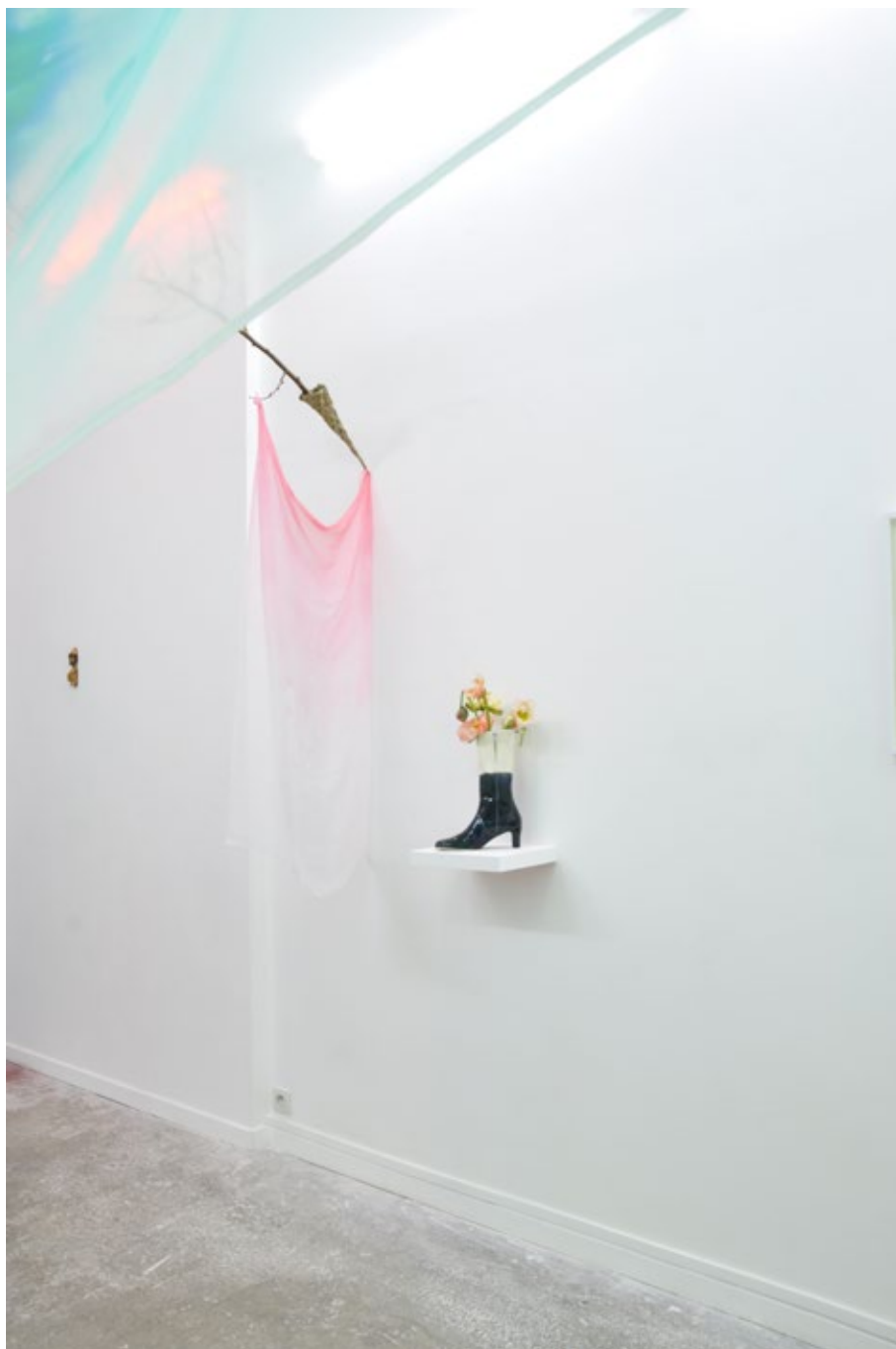
Vue d'exposition, Jérémie Paul, Opaline et Vâyou , janvier 2016, © Grégoire Perrier