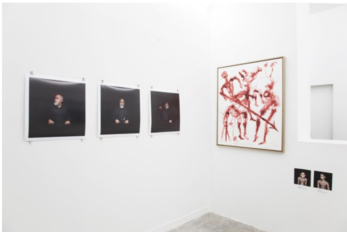
Vue d'exposition, Barthélémy Toguo, Fred Forest, Ernest Breleur, Orlando Britto Jinorio, Iris Della Roca, Le Monde est en panne d'une pensée pour le monde , septembre 2016