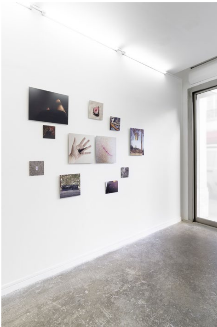
Vue d'exposition, Dani Soter, Avec elle, sans elle , mars-mai 2018