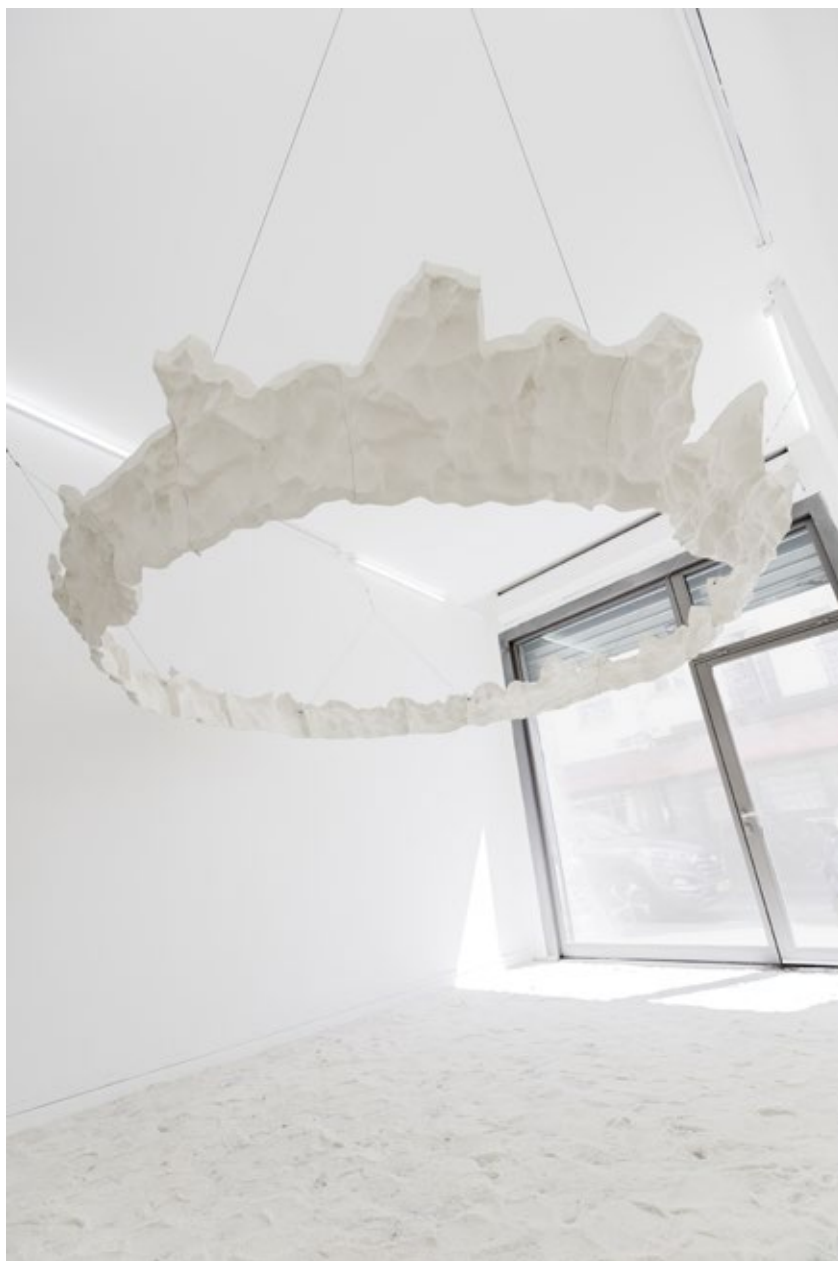
Vue d'exposition, Emmanuel Rivière, Le bruit des nuages , mai-juin 2017