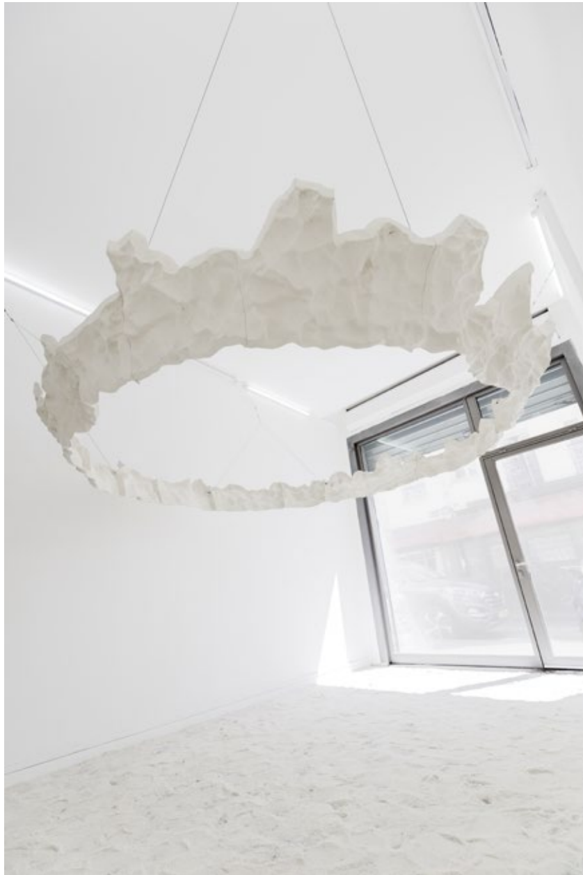
Exhibition view, Emmanuel Rivière, Le bruit des nuages , May-June 2017