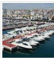
NACE ART MARBELLA, LA PRIMERA FERIA DE ARTE DE LA COSTA DEL SOL