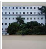
IVÁN CANDEO: CORTE EN MOVIMIENTO