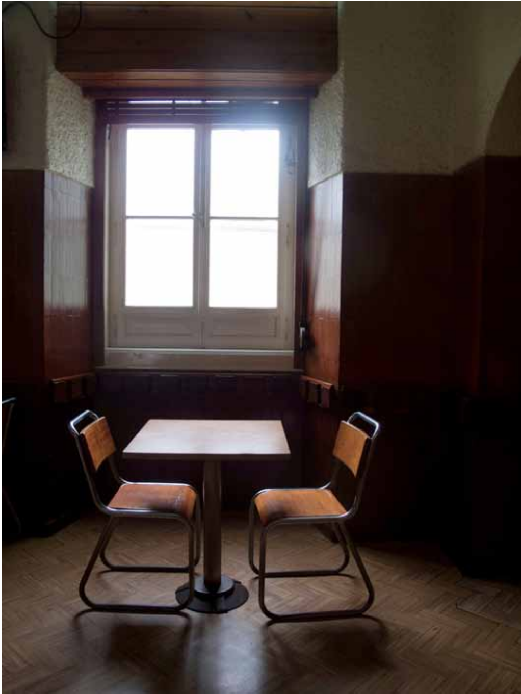
Le dialogue , Impression Fine Art sur papier coton, 110 x 85 cm, 2014 © Dani Soter, courtesy Maëlle Galerie