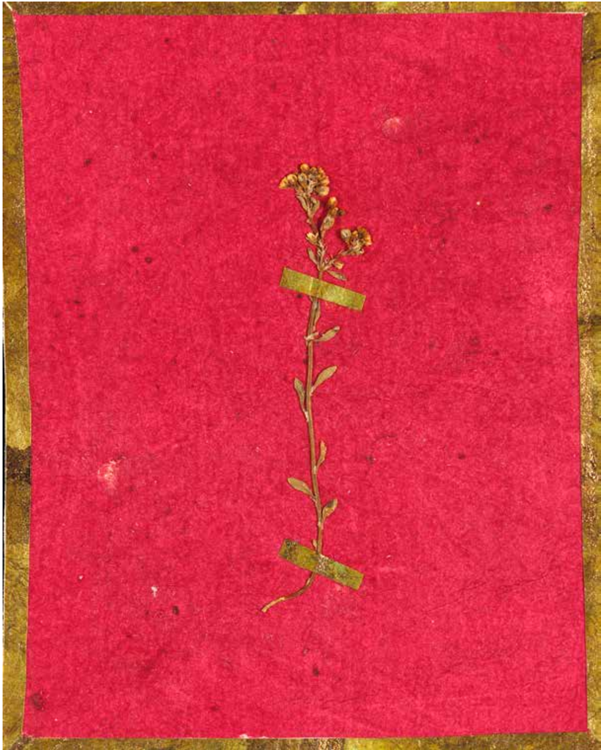
Malysse, Courroyette des prairies , série bioperversité, impression fine art, 90 x 120 cm, 2013, 20 exemplaires