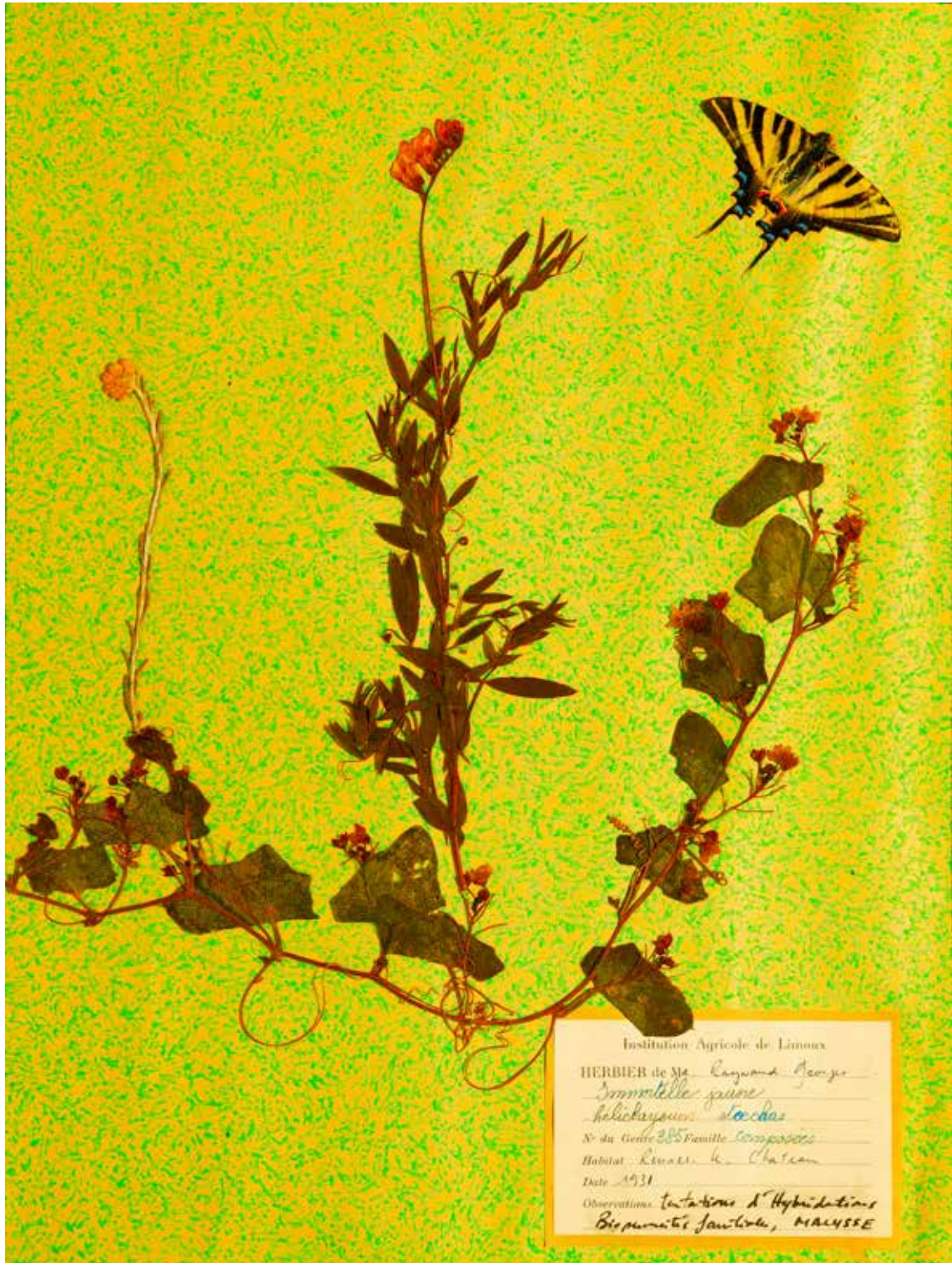
Malysse, Immortelle Jaune , série bioperversités familiales, impression fine art, 90 x 120 cm, 2013, 20 exemplaires