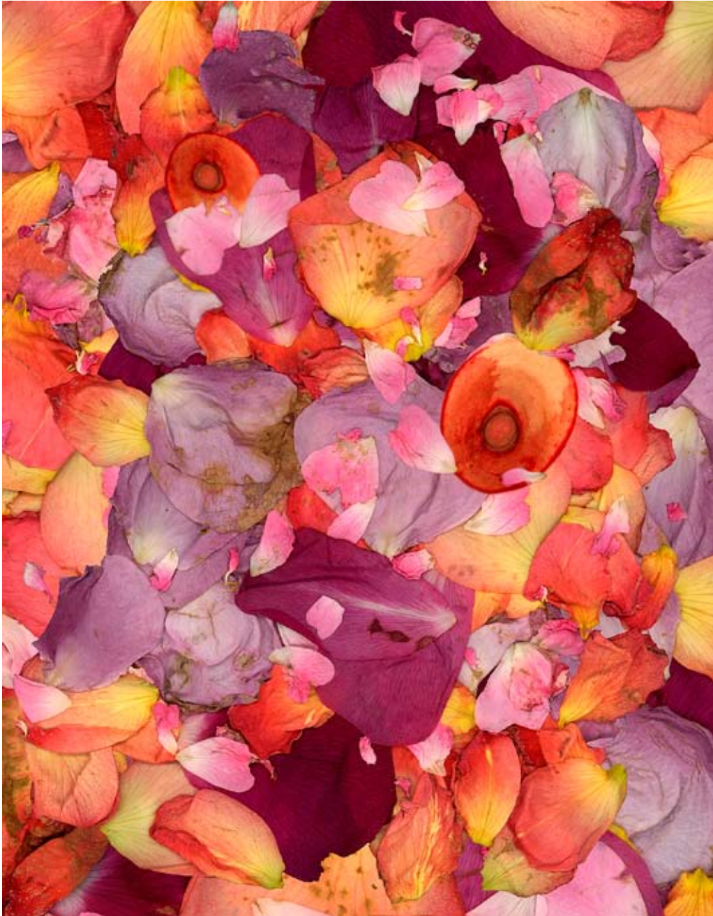
Antoine Poupel, Sans titre, 102 x 132 cm, 2000 © Antoine Poupel