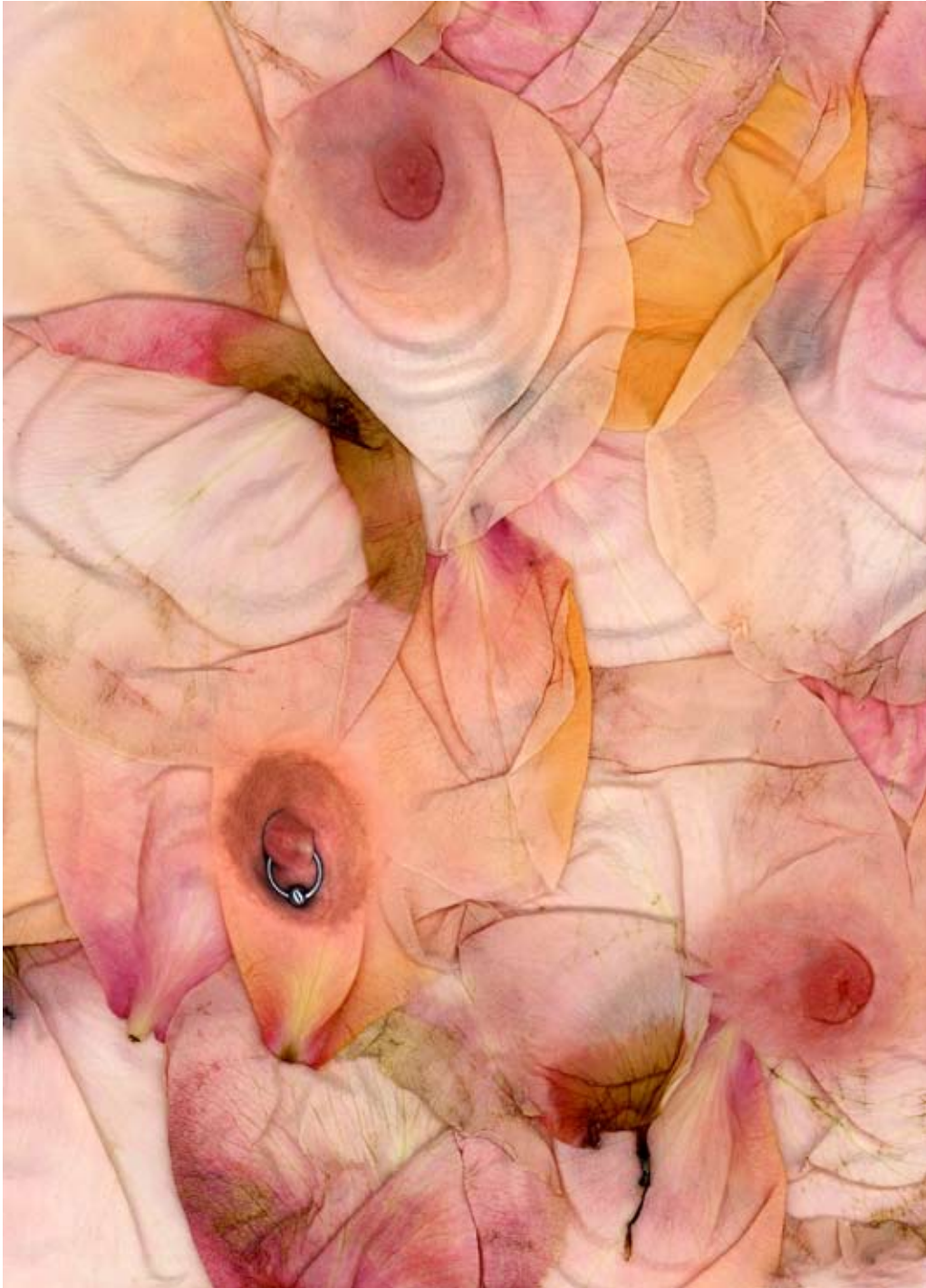
Antoine Poupel, Sans titre, 102 x 141 cm, 2000 © Antoine Poupel