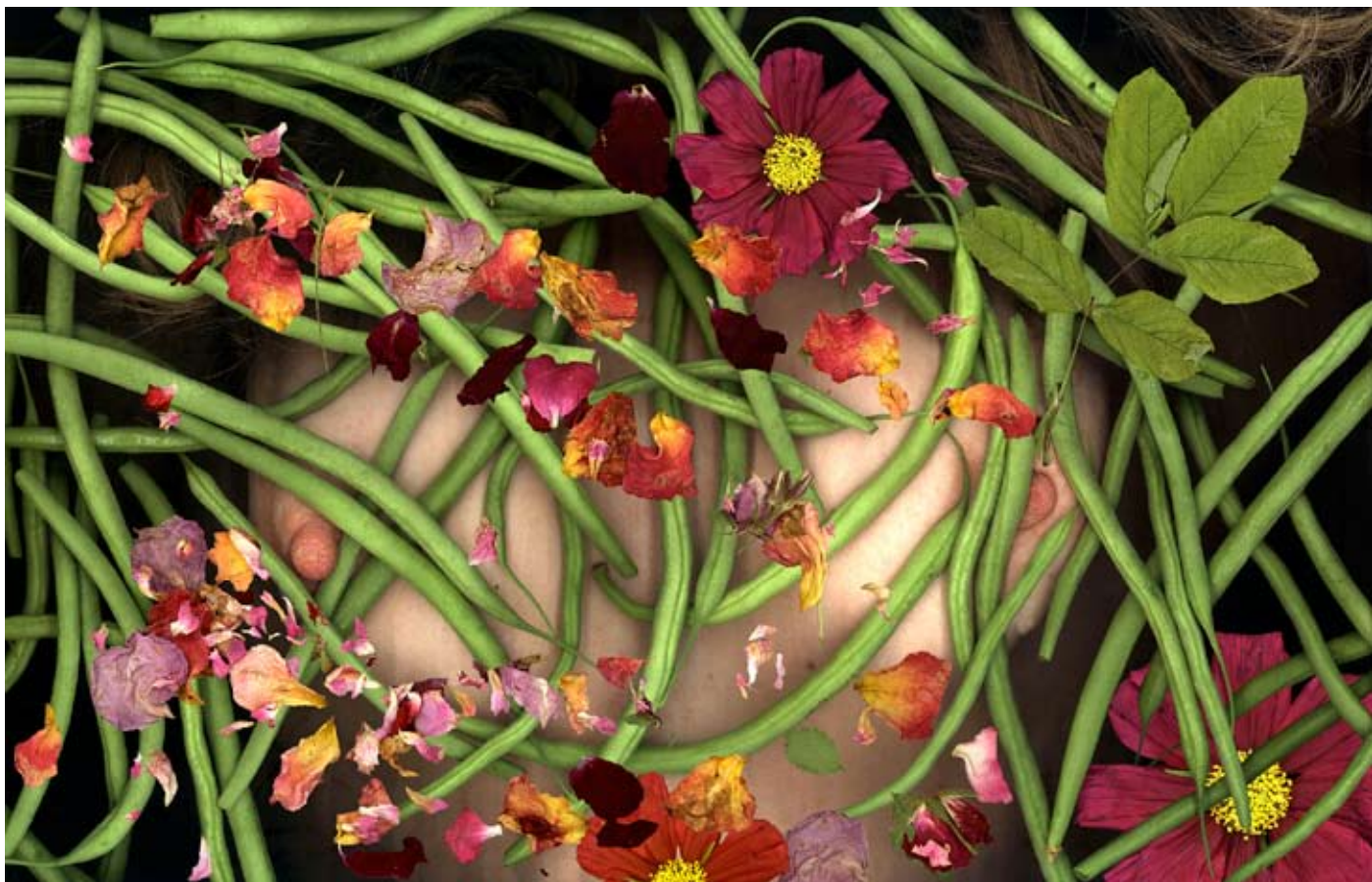
Antoine Poupel, Sans titre, 103 x 159 cm, 2000