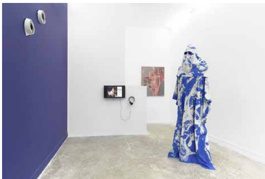
Qui es-tu lorsque personne ne te regarde ? , vue d'exposition, janvier 2018, Maëlle Galerie