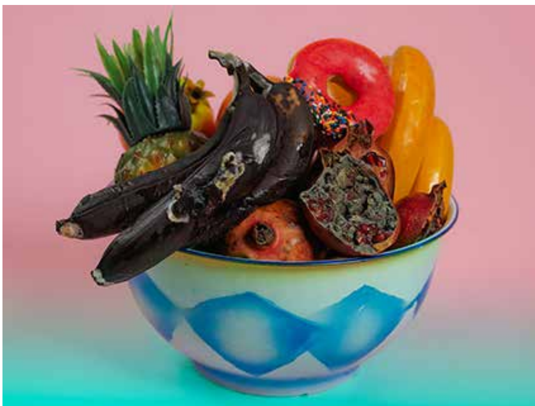
Christo and Andrew, Neo Bodegon, 120 x 90 cm, 2014