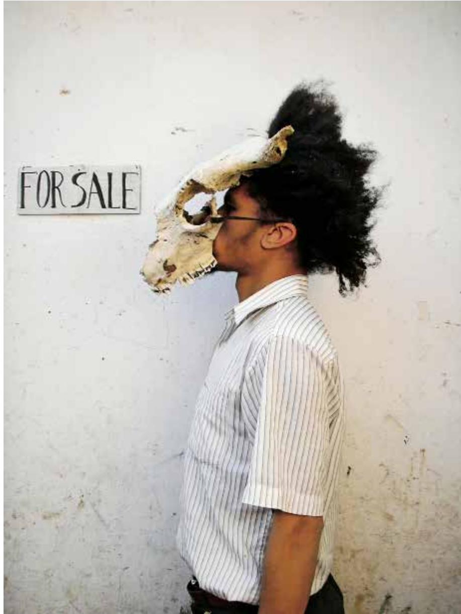
Paulo Nazareth, Sans titre, série Para Venda, Impression sur papier cotton, 93 x 70 cm, 2011