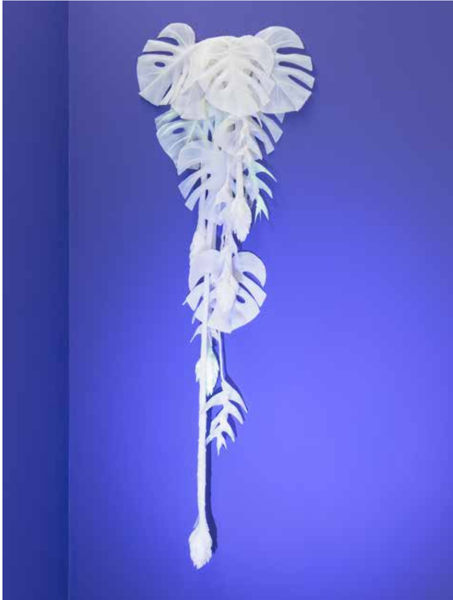
Desi Santiago, Andromeda, Silicone, 160 x 40 cm, 2019