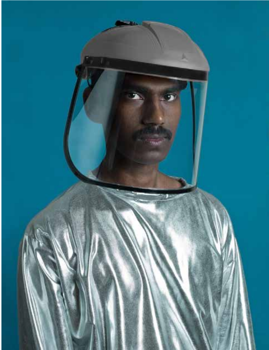
Christo and Andrew, The Collapse of time, 70 x 90 cm, 2015, Courtesy Espai Tactel