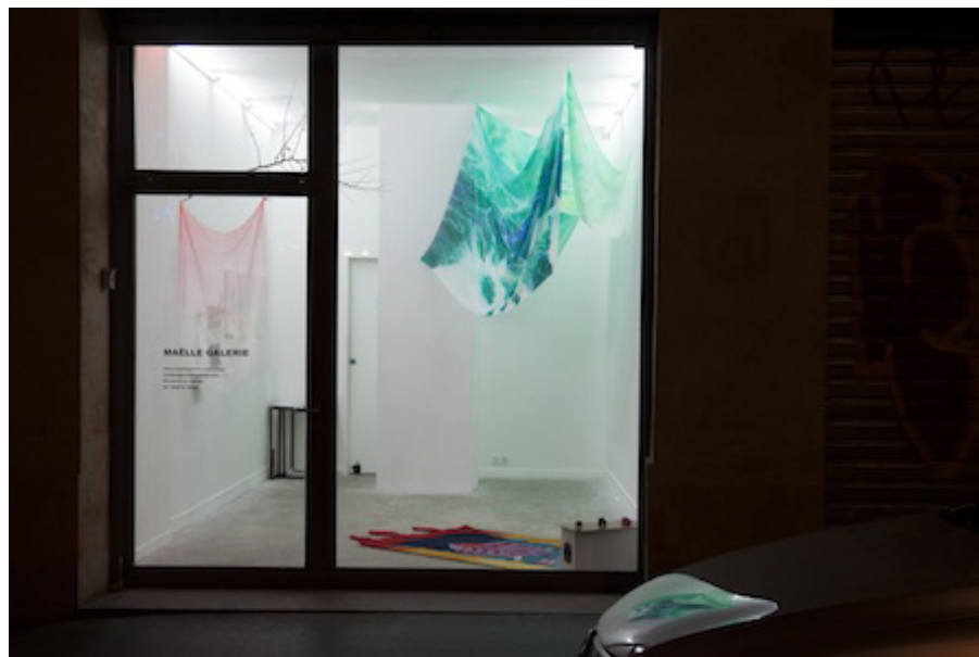
Opaline et Vâyou, vue d'exposition, janvier 2016, Maëlle Galerie

Également consciente que la scène artistique demeure dans un éternel renouvellement de ses acteurs, la Maëlle Galerie, galerie d'art contemporain, a aussi posé son regard sur les artistes caribéens qui ouvrent et bouleversent tous les champs des possibles. La galerie porte une attention toute particulière aux jeunes et grands noms de la Caraïbe.