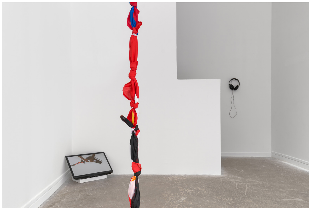
Jean-François Boclé, Attachement aux quatre coins - Amarrar mundele , installation vidéo, vidéo (HD,couleur, son, 16/9, 19:30), drapeaux des pays représentés à la Conférence de Bandung noués les uns aux autres dimensions variables, du plafond au sol), 2017