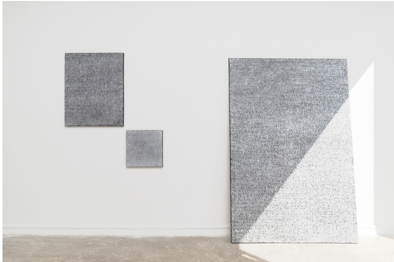
Série Craie blanche sur fond noir, peinture pour tableau d'école sur toile, craie blanche, 2018