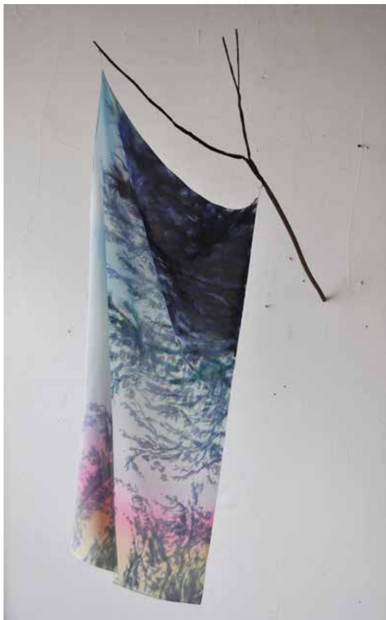
Jérémie Paul, « couché de soleil » peinture sur soie, tube de cuivre martelé 90 x 50 cm, 2016