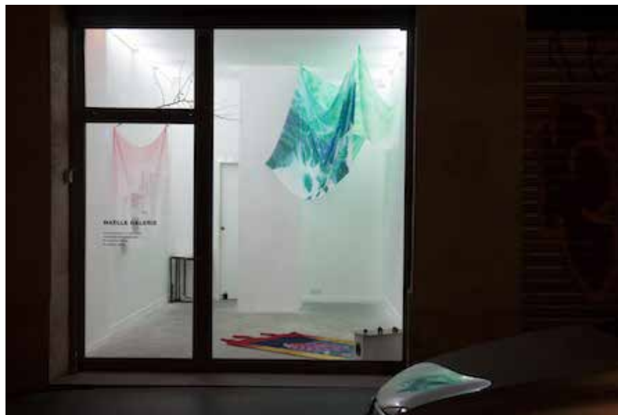
Opaline et Vâyou, vue d'exposition, janvier 2016, Maëlle Galerie

La Maëlle Galerie compte aujourd'hui 14 artistes émergents originaires de France, Brésil, Pologne, Australie, Guadeloupe, Martinique, Guyane, Haïti, et l'Espagne.