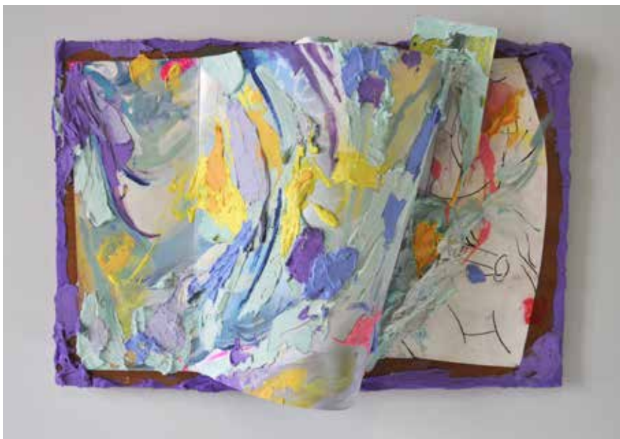
Jérémie Paul, « Livre 2/3 », technique mixte sur bois papier livre 45 x 30 cm, 2016