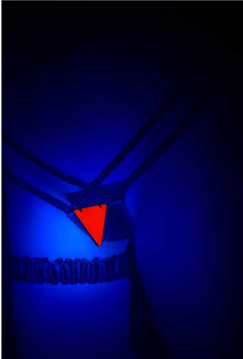
Antoine Poupel, sans titre, série Crazy Horse inside , 40 x 50 cm