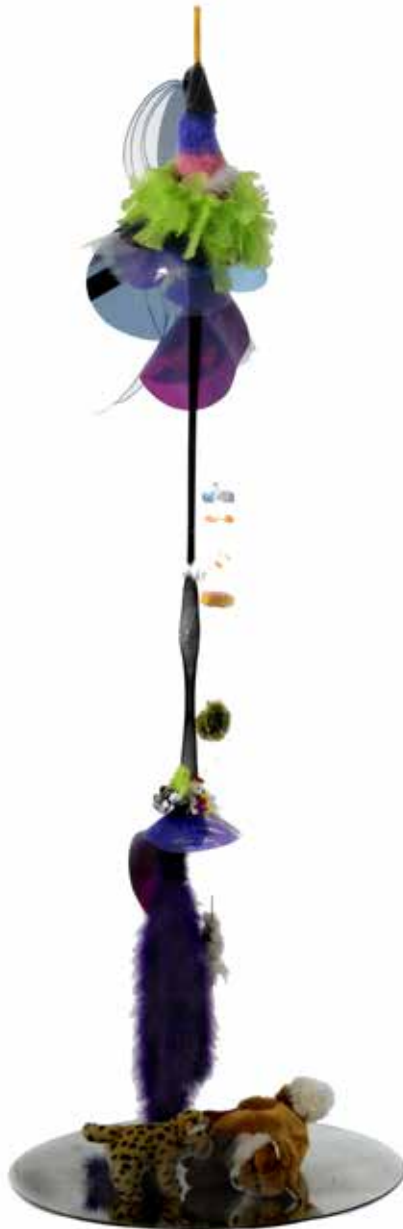
Ernest Breleur, sans titre, série Féminin 2 , film polyester, agrafes, appareils féminins, 210 x 45 x 31 cm 2015