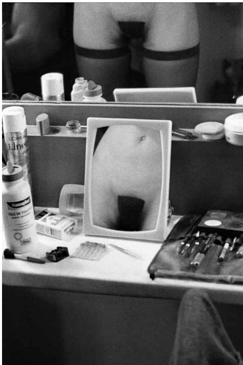
Antoine Poupel, sans titre, série Crazy Horse inside , 40 x 50 cm