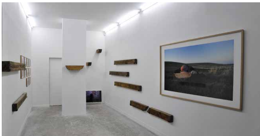
Entre l'enthousiasme et l'abîme, vue d'exposition, octobre 2015

La Maëlle Galerie compte aujourd'hui 14 artistes émergents originaires de France, Brésil, Pologne, Australie, Guadeloupe, Martinique, Guyane, Haïti, et l'Espagne.