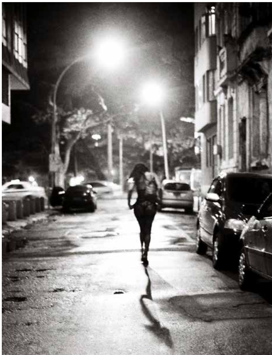
Iris Della Roca, sans titre, God's creatures , Lapa, Rio, Brésil, impression sur plexiglass, 30 x 23 cm, 2013