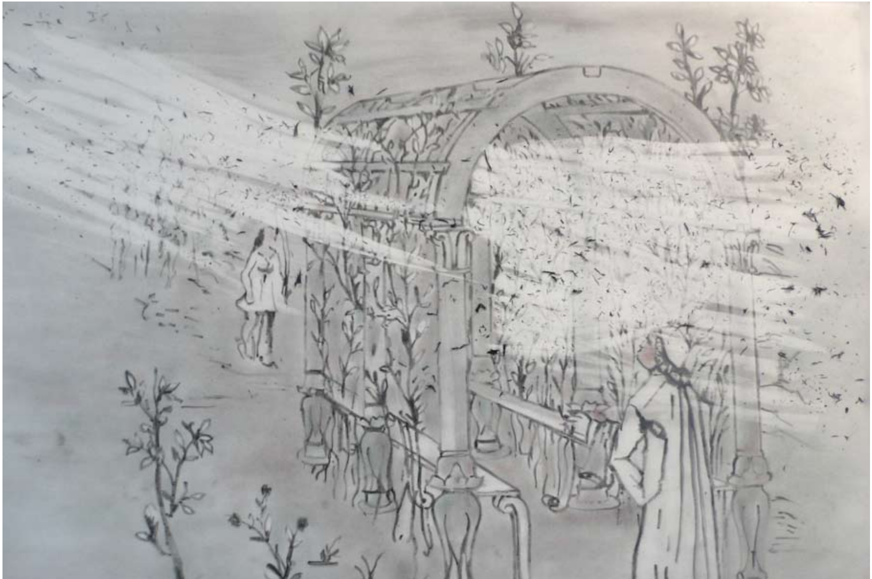
Sans titre, série simplement gommer , mine de plomb, chiure de gomme sur papier, 120 cm x 85 cm, 2012