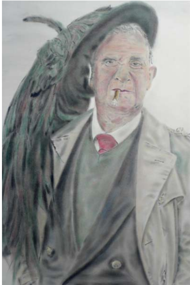
Sans titre, série simplement gommer , mine de plomb, chiure de gomme sur papier, 120 cm x 85 cm, 2012