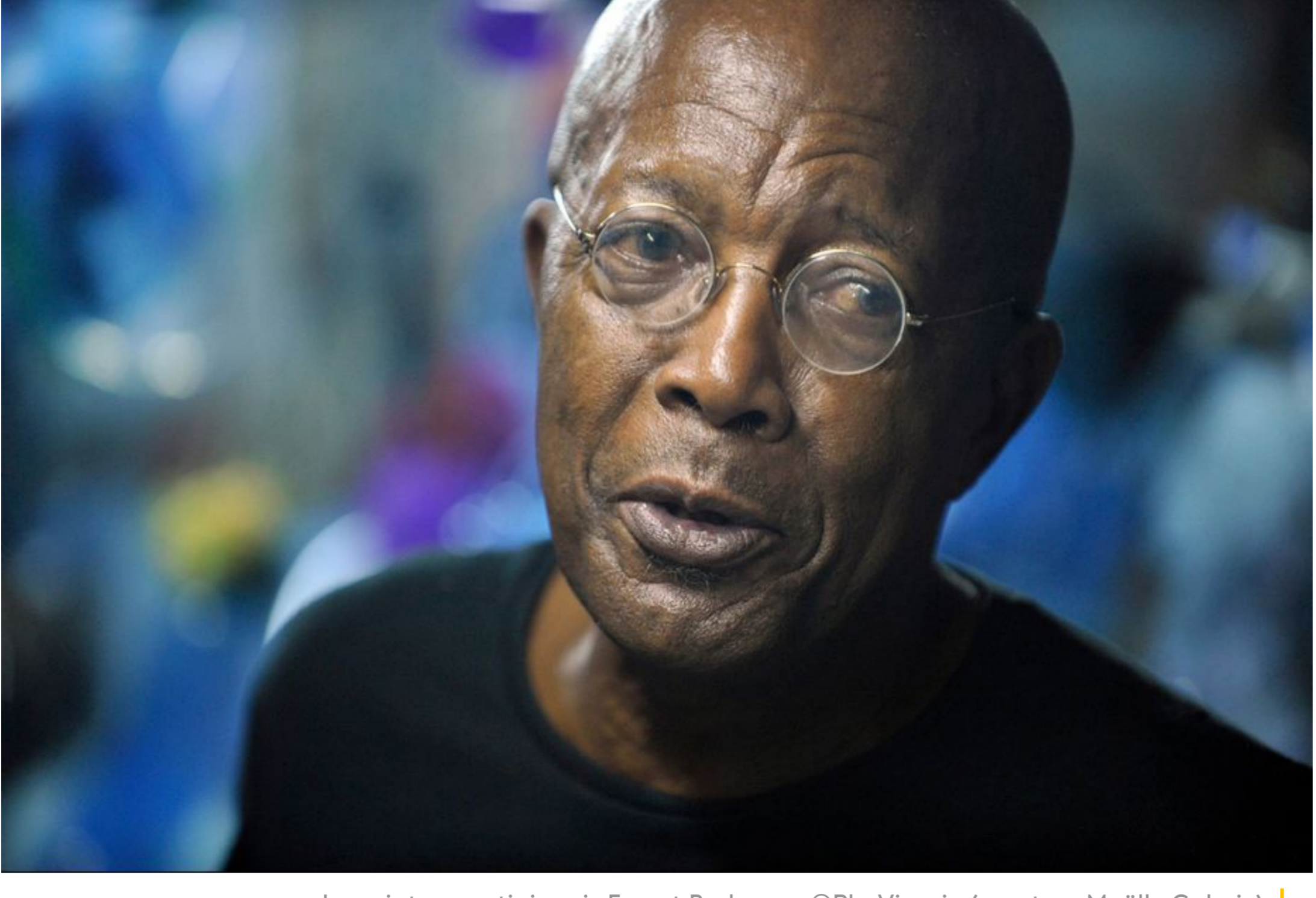
Le peintre martiniquais Ernest Breleur

"Big Bang Boom ! A cosmic poetry" (une poésie cosmique). C'est l'intitulé de la nouvelle exposition du prolifique peintre martiniquais Ernest Breleur, à voir jusqu'au 18 juillet à la Maëlle Galerie à Paris.