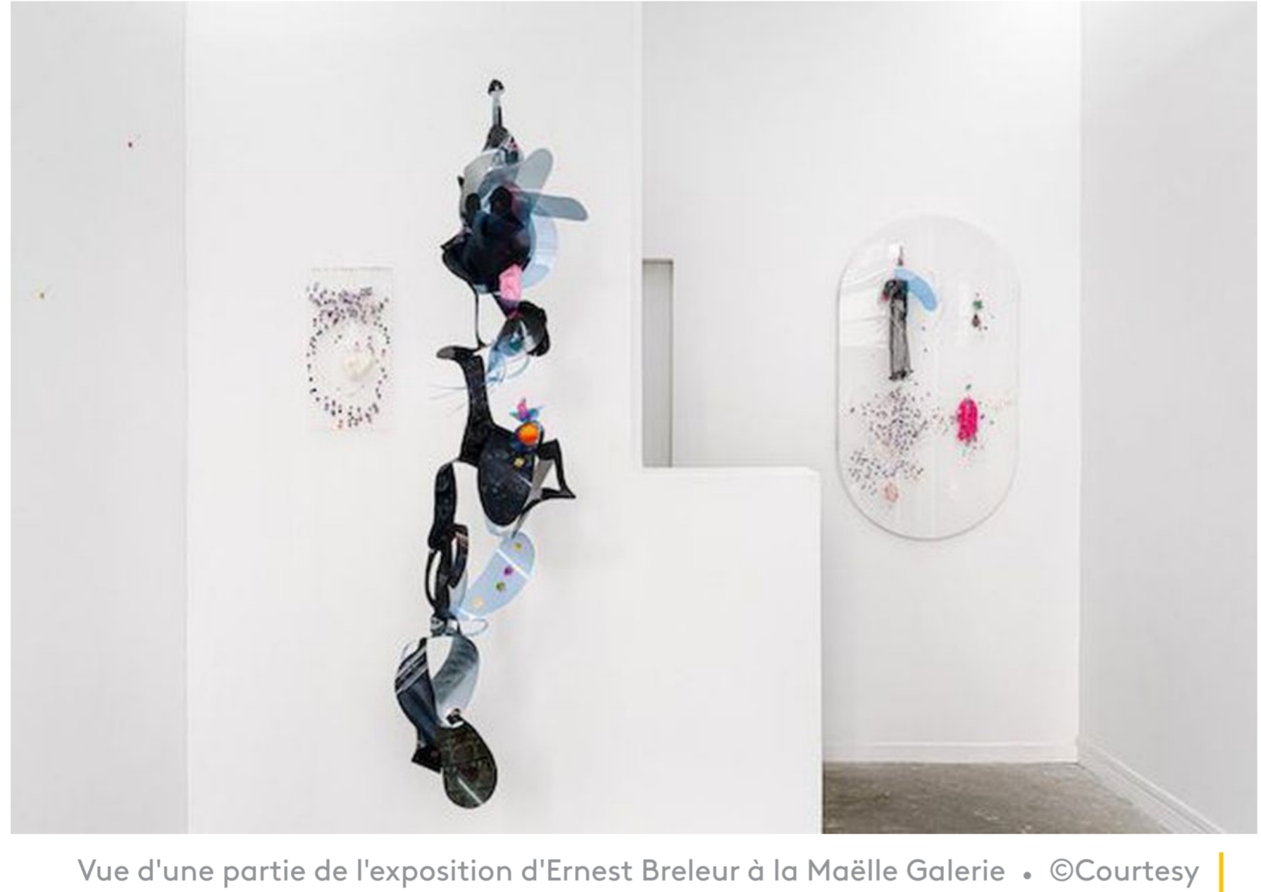
Vue d'une partie de l'exposition d'Ernest Breleur à la Maëlle Galerie

Ernest Breleur trouve que son travail possède une certaine résonance dans la crise sanitaire et écologique que le monde traverse actuellement, où il est question de la disparition du vivant. « Il faut réenchanter ce monde-là avec une espèce de légèreté, sortir de cette gravité, proposer des choses qui laissent à espérer sur la question du vivant », affirme le peintre.