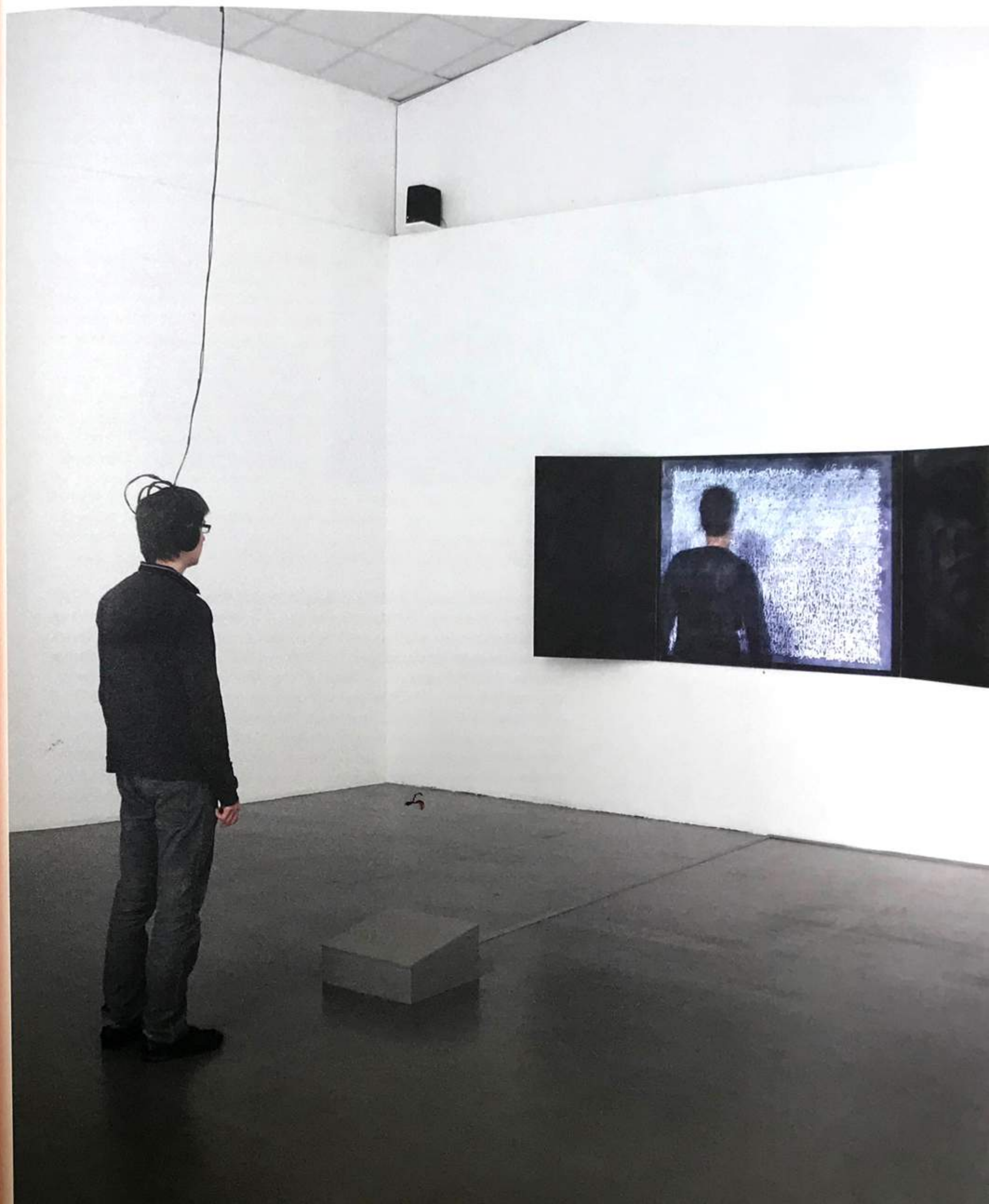
Jean-François Boclé, Tu me copieras , 2004. Installation vidéo et sonore, DVD (vidéo diffusée en boucle, durée : 27 min. 30 sec., tableau d'école mural noir, 270 x 110 x 30 cm (bois, charnières à piano, peinture pour tableau, écrits sur le tableau à la craie), casque audio suspendu, deux enceintes, le Code Noir avec préface de l'artiste diffusé au public, dimensions variables. Avec l'aimable permission de Maëlle Galerie. © Jean-François Boclé/Adagp.